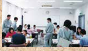
中学生、大人コース